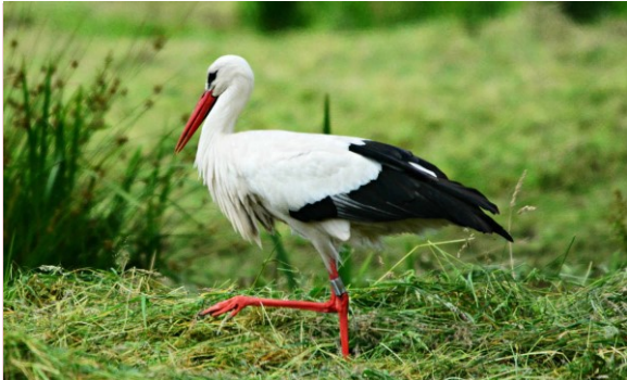
Zař. Nr 2.